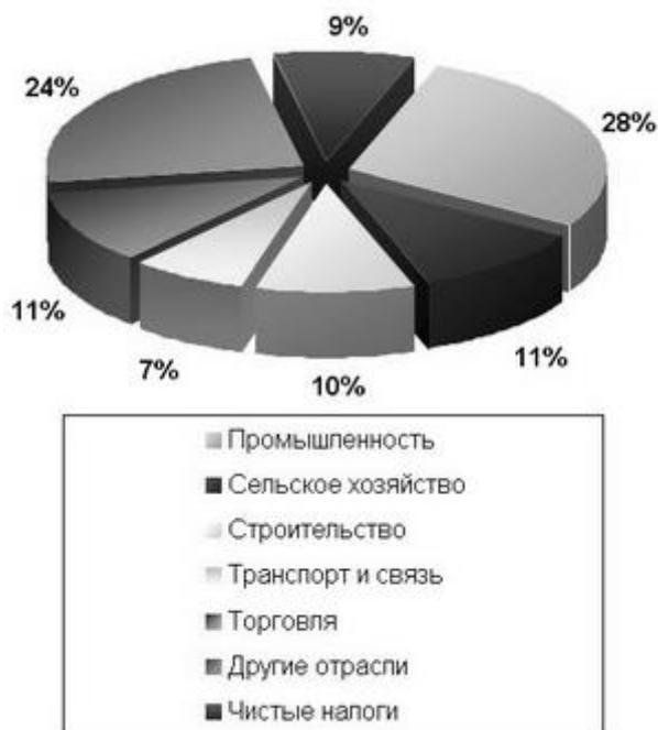
Рис. 2.4. Отраслевая структура ВРП

Таблицы применяют для повышения наглядности, удобства сравнения каких-либо показателей и систематизации материала.